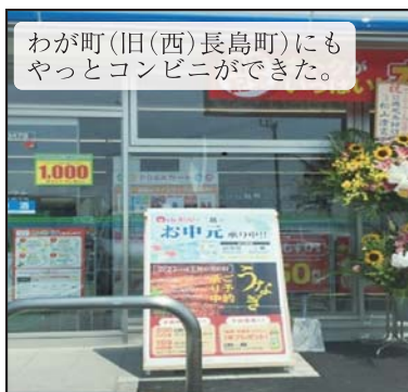
わが町(旧(西)長島町)にもやっとコンビニができた。