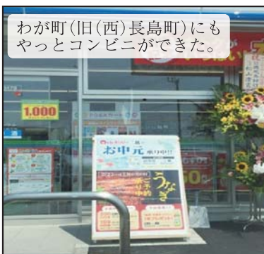
わが町(旧(西)長島町)にもやっとコンビニができた。